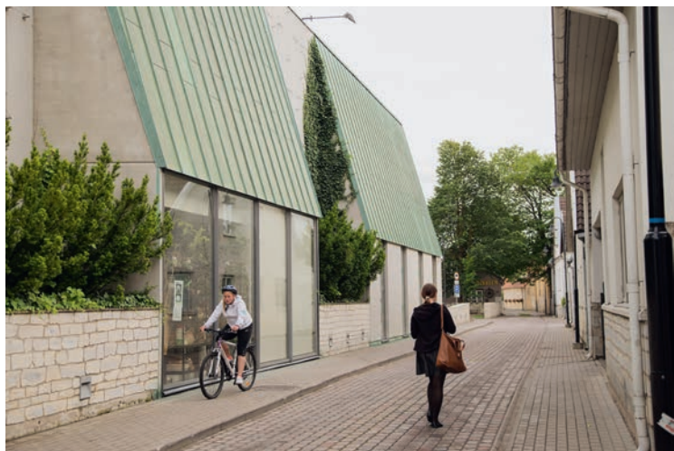
Saaremaa Kaubamaja, Raekoja 1. Arhitekt Pia Tasa (EA Reng AS)