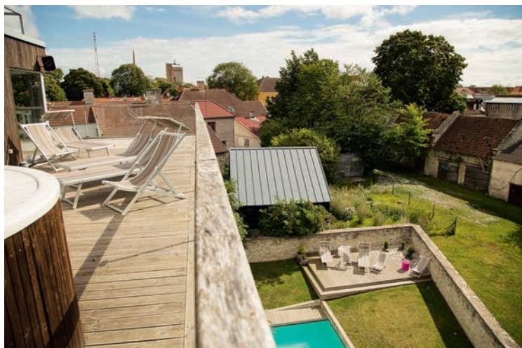
Johan SPA Hotell, Kauba 13. Arhitektid Tarmo Teedumäe, Inga Raukas, Toomas Tammis (Arhitektuuriagentuur OÜ)