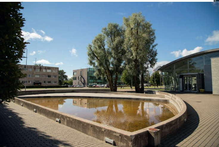
Endise mõisatiigi uuendus Reval Auto Kuressaare esinduse ees, Tallinna 61a. Ehitusprojekt Madis Nõmm (Klotoid OÜ)