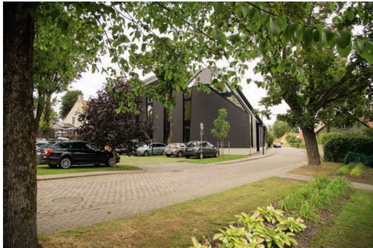
Arensburg SPA Hotell, Lossi 15. Arhitektid Raivo Kotov, Margit Aule (toona Kärner), Lea Laidra ja Tõnis Savi (KOKO Arhitektid OÜ)