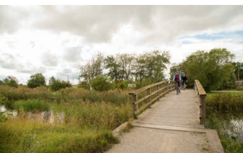
Mereäärne jalgrattatee. Ehitusprojekt Klotoid OÜ