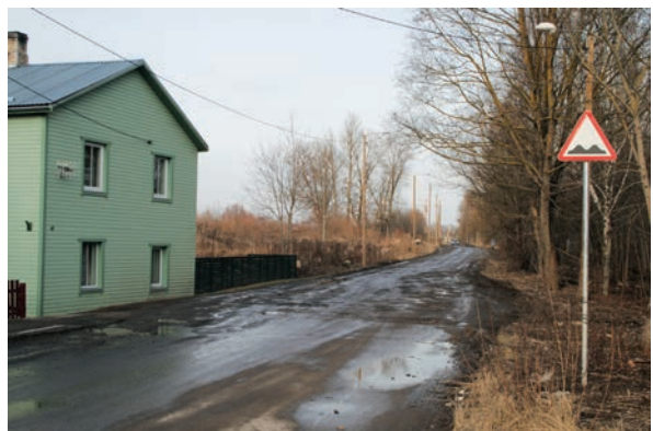
Roosi tänav enne projekteerimist 2014.aastal, endise sõjaväeala värava kohal