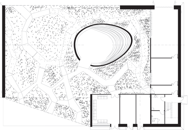
2. korruse plaan