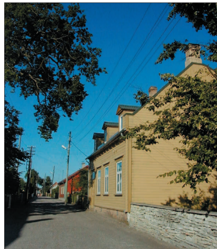
Näide kaitstavast miljööalast: Mere tänav Tori miljööväärtuslikul hoonestusalal